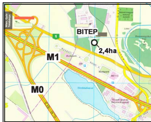
A terület elhelyezkedése

Közvetlen telekszomszédjai: a Posta Országos Logisztikai Központja, valamint a Budaörsi Ipari és Technológiai Park (BITEP). 1km-es körzetében található: a budaörsi METRO és OBI áruház, a Premier Outlet Center, valamint egy MOL benzinkút.