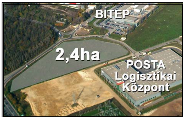
A terület légi felvételen

A BITEP cégek számára egy magántársaság által üzemeltetett, a munkaidő kezdetéhez és végéhez igazodó buszjárat segítségével lehet kijutni a parkba.